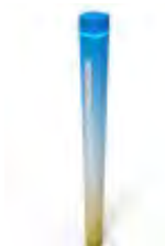
Εκτύπώσεις Πλαισίου Κατά Παραγγελία