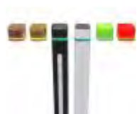
Χρωματισμοί Τελειώματος Κατά Παραγγελία