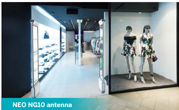
NEO NG10 antenna

Ο σωστός σχεδιασμός μια αντένας EAS ταιριάζει με τη συνολική αισθητική του καταστήματος και δεν επηρεάζει το εταιρικό branding ή την αγοραστική εμπειρία, κάτι που καθίσταται όλο και πιο σημαντικό στη βιομηχανία λιανικής.