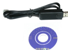
Καλώδιο αναβάθμισης USB (προαιρετικό)